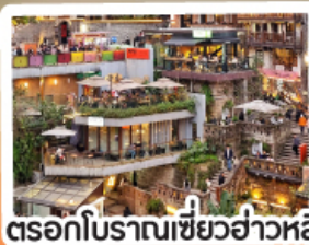
ตรอกโบราณเซียวฮ่าวหลี่