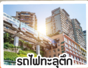
รถไฟฟ้าทะลุติ๊ก