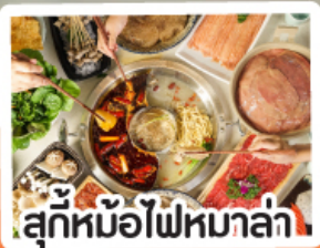
สุกี้หม้อไฟหม่าล่า