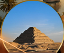
พีระมิดขั้นบันได