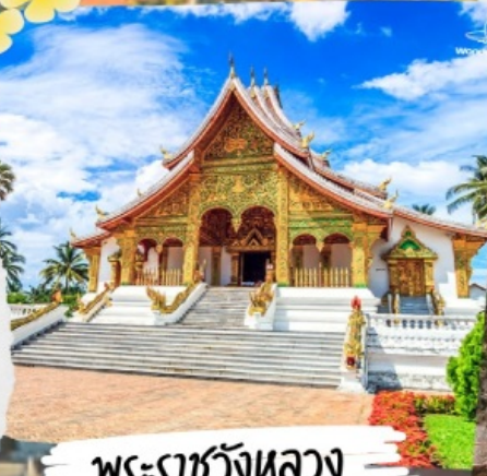
พระราชวังหลวง