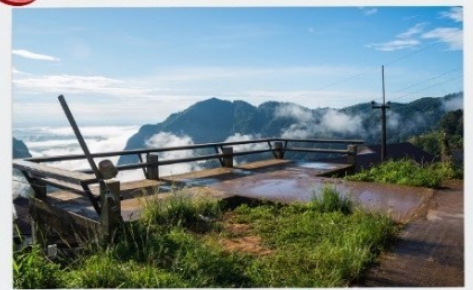
ดอยผาตั้ง