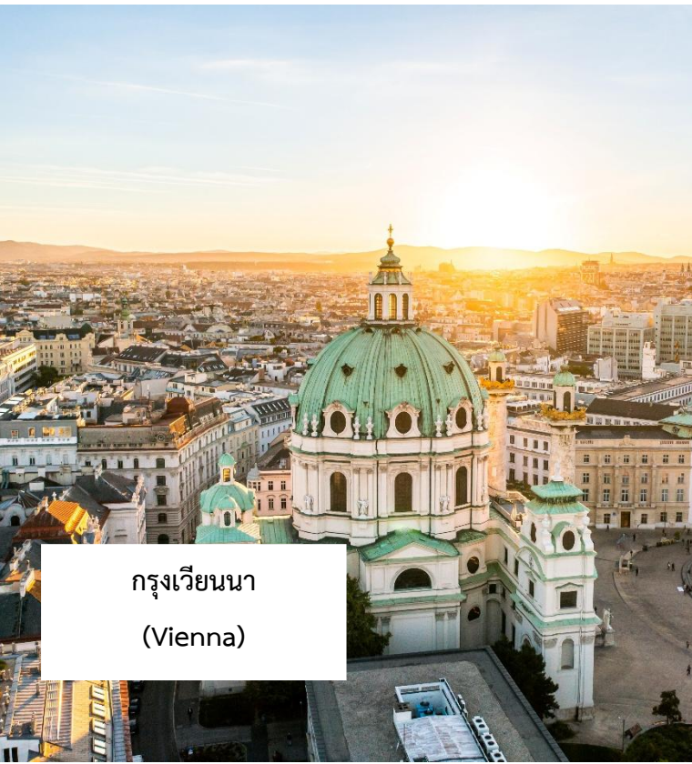
กรุงเวียนนา (Vienna)

เมนูพิเศษ!!! กลูซซูป อาหารประจำชาติฮังการี