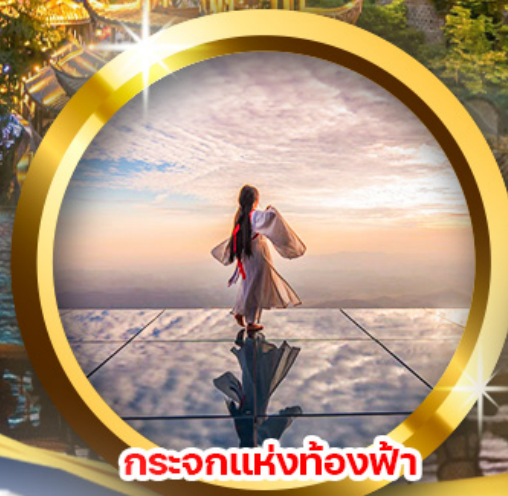
กระบอกแห่งท้องฟ้า