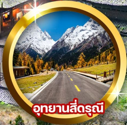
อุทยานสี่ดรุณี