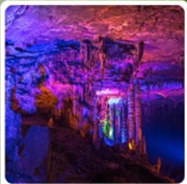
ถ้ำเก้าเทพ