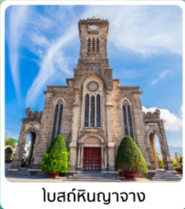
โบสถ์หินญาจาง