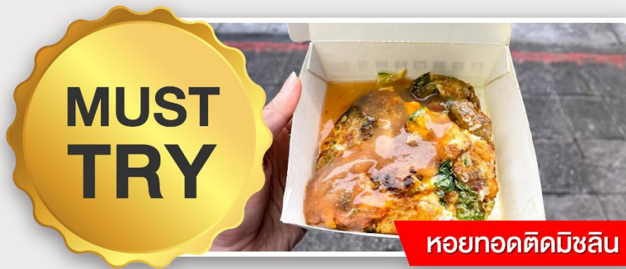
หอยทอดติดมิชลิน

อิสระอาหารเย็นตามอัธยาศัย ณ ตลาดกลางคืนหนิงเซี่ย