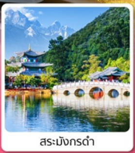
สระม้งกรดำ