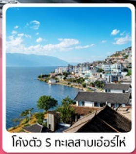
โค้งตัว 5 ทะเลสาบเอ๋อร์ไห่