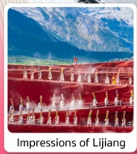
Impressions of Lijiang

ไฮไลท์ เที่ยวครบ คุนหมิง ต้าหลี่ ลี่เจียง แชงกรี่ล่า นั่งกระเช้าขึ้นภูเขาหินะมิงกรยก ชมโชว์ "Impression of Lijiang"