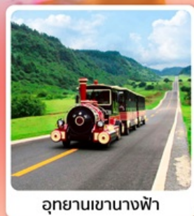
อุกยานเขานางฟ้า