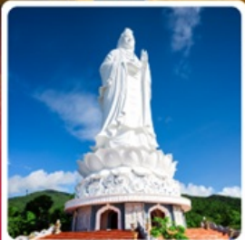
วัดลินฮั้ง