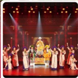
The Heritage Show