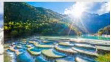
ทะเลสาบโป๋สุ่ยเหอ

*ทางบริษัทฯ ขอสงวนสิทธิ์ในการลบบโปรแกรมทัวร์ตามความเหมาะสมขึ้นอยู่กับสถานการณ์ปัจจุบัน โดยคำนึงถึงผลประโยชน์ของลูกค้าเป็นสำคัญ