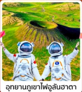
อุทยานภูเขาไฟอุลันฮาตา