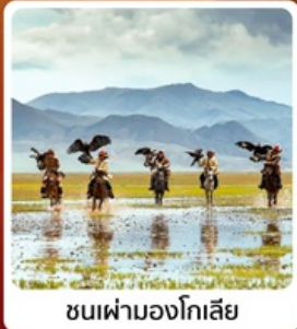
ชนเผ่ามองโกเลีย