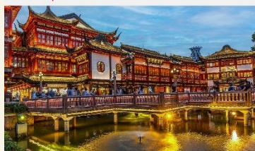
ตลาด 100 ปีเงินหวงเหมียว