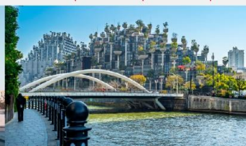
เทียนอันเซียน(อาคารพินตันไม้)