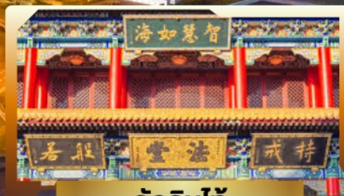
วัดจีนไท้