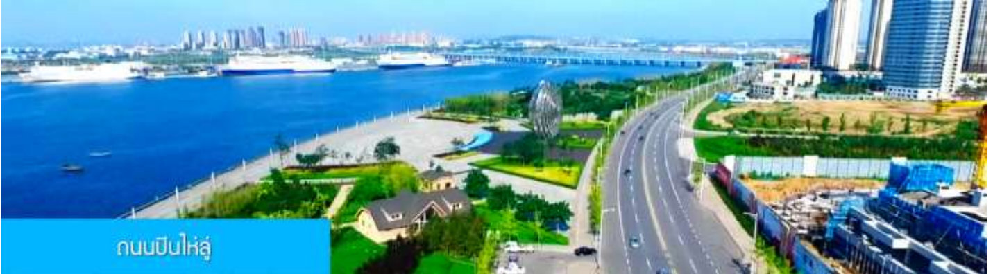
ถนนปินไห่หลู่

ล้อมด้วยตึกระฟ้าที่ทันสมัย ภายในมีบ่อน้ำพุดนตรี ลานหญ้าขนาดใหญ่ และลานกว้างสำหรับจัดกิจกรรม กลางแจ้ง อาทิ เทศกาลเบียร์นานาชาติ การแข่งขันวิ่งมาราธอน งานแฟชั่นนานาชาติเมืองต้าเหลียน ฯลฯ