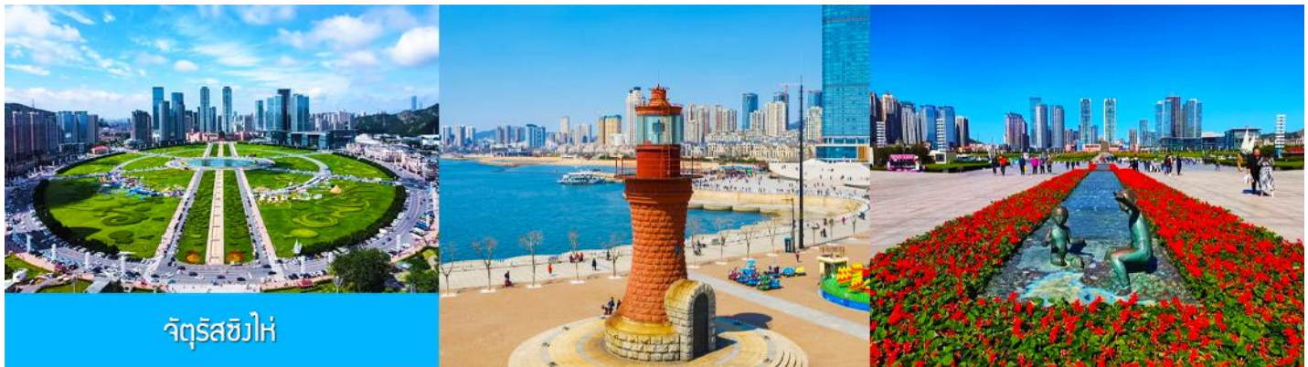
จัตุรัสชิงไห่

นำท่านเที่ยวชม จัตุรัสชิงไห่ 星海广场 เป็นจัตุรัสขนาดใหญ่เป็นแลนด์มาร์คสำคัญของเมืองต้าเหลียน สร้างขึ้นเพื่อเฉลิมฉลองในโอกาสที่รัฐบาลอังกฤษคืนเกาะฮ่องกงในให้จีนในปี ค.ศ. 1997 ตั้งอยู่ชายฝั่งทะเลในเมืองต้าเหลียน เป็นจัตุรัสใจกลางเมืองที่ใหญ่ที่สุดในโลกและเป็นแลนด์มาร์คของเมืองต้าเหลียน รายล้อมด้วยตึกกระจาที่ทันสมัย ภายในมีบ่อน้ำพุดนตรี ลานหญ้าขนาดใหญ่ และลานกว้างสำหรับจัดกิจกรรมกลางแจ้ง อาทิ เทศกาลเบียร์นานาชาติ การแข่งขันวิ่งมาราธอน งานแฟชั่นนานาชาติเมืองต้าเหลียน ฯลฯ