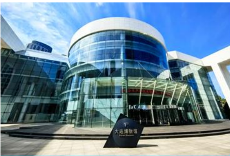
พิพิธภัณฑ์ต้าเหลียน

รับประทานอาหารเช้า ณ ห้องอาหารของโรงแรม (13)