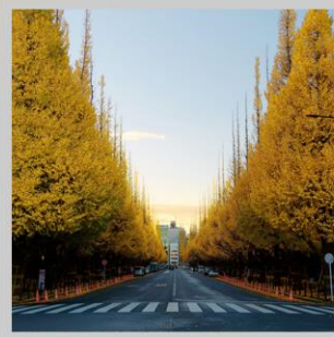
“ICHONAMIKI GINGO AVENUE”