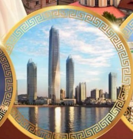
ชมวิวดาคารไธตัน เซ็นเตอร์