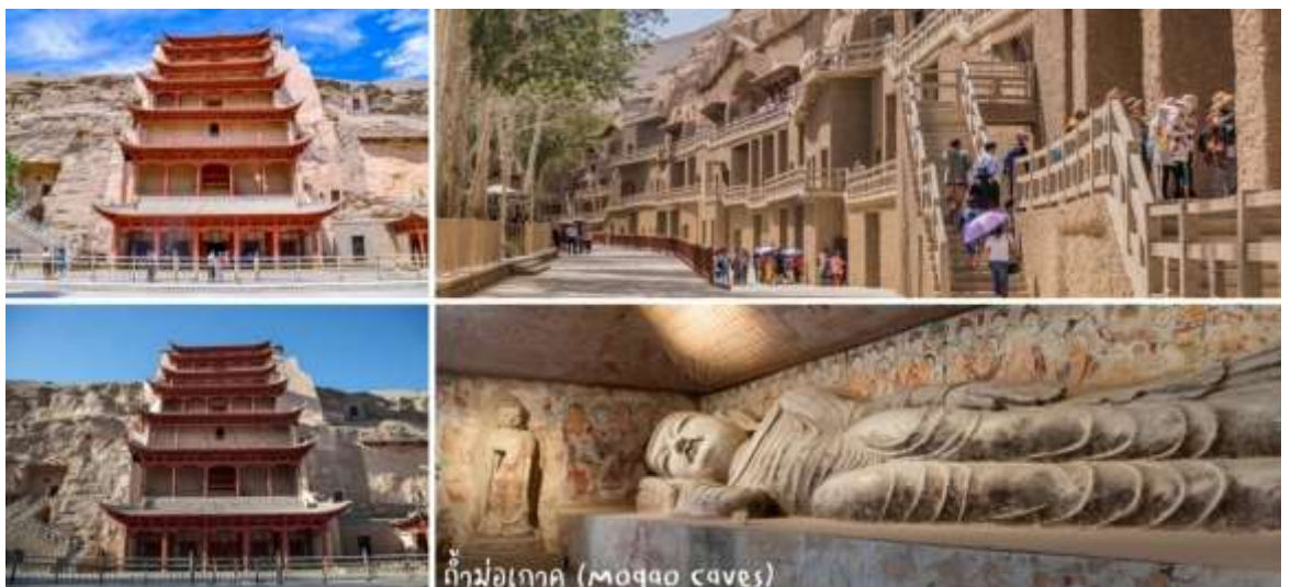
ถ้ำม่อเกาอู (Mogao caves)

จากนั้นนำท่านชม ถ้ำม่อเกาอู (Mogao Caves) อยู่บริเวณหน้าผาของเขามิงซาซาน หรือที่รู้จักกันในชื่อ "ถ้ำพระพุทธรูปพันองค์" เป็นหนึ่งในศาสนสถานและแหล่งพุทธศิลป์ที่ยิ่งใหญ่และมีชื่อเสียงที่สุดของจีน ตั้งอยู่ที่เมืองตุนหวง มณฑลกานซู่ ทางตะวันตกเฉียงเหนือของประเทศจีน เริ่มสร้างขึ้นตั้งแต่ศตวรรษที่ 4 (ประมาณปี ค.ศ. 366) และมีการสร้างต่อเนื่องยาวนานกว่า 1,000 ปี ผ่านราชวงศ์ต่างๆ กว่า 10 ราชวงศ์ ภายในถ้ำประกอบด้วยจิตรกรรมฝาผนังเนื้อที่รวมกว่า 45,000 ตารางเมตร และรูปปั้นสีมากกว่า 2,000 องค์ ซึ่งสะท้อนถึงศรัทธาและความประณีตในแต่ละยุคสมัย : เป็นสถานที่ค้นพบ "ถ้ำเก็บพระคัมภีร์" (Library Cave) ซึ่งบรรจุเอกสาร คัมภีร์ และโบราณวัตถุสำคัญกว่า 50,000 รายการ ได้รับการขึ้นทะเบียนเป็นมรดกโลกโดย UNESCO ในปี พ.ศ. 2530 ในฐานะแหล่งรวมพุทธศิลป์ที่สมบูรณ์ที่สุดแห่งหนึ่งของโลก (รวมรถให้อูทยาน+ใช้ตัวประเภท B)