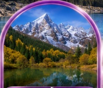
อุทยานปี้ผิงโกว (รวมรถกอล์ฟ)