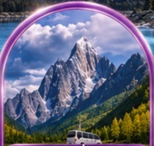
อุทยานสี่ดรุณี (รวมรถอุทยาน)