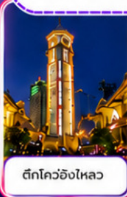
ตึกโควอชิงไหลว