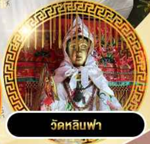
วัดหลิวฟา