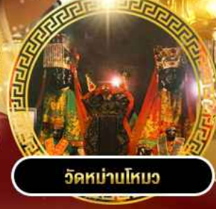
วัดบ้านโหมง