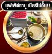
บุฟเฟ่ต์ซาบู เบียร์ไม่อั้น!!