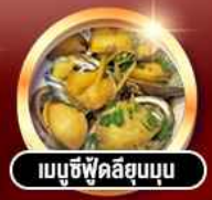
เมนูซีฟู้ดลิ้นจี่