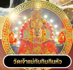
วัดเจ้าแม่กิมกิมหลิว