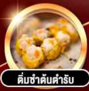
ต้มซ่าตันตำรับ