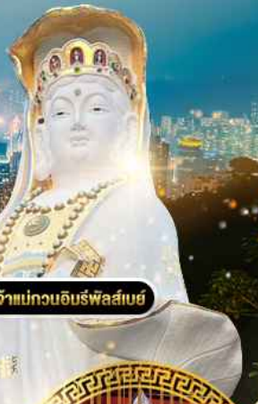
วัดเจ้าแม่กวนอิมรัฟลัสเบย์