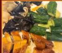
ไก่ แดงกวาง เห็ดหูหนู