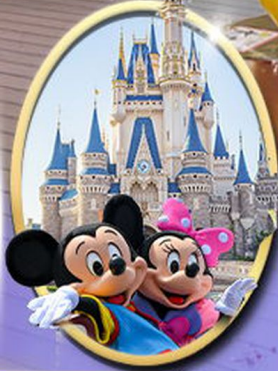
อิสระเลือกซื้อบัตร Tokyo Disneyland