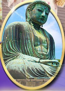
พระใหญ่คามาคูระ