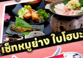
เช็กเมนูย่าง ใบโอบะ