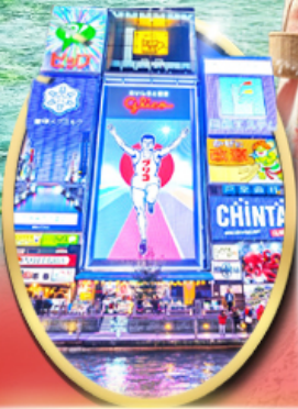
ซ็อบบิง ซินโซบาสึ