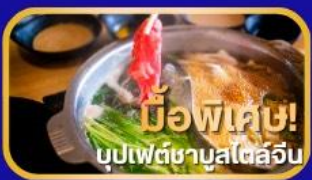
มือพิเศษ! บุปเพ็ดชาบูสไตลิ่งจีน