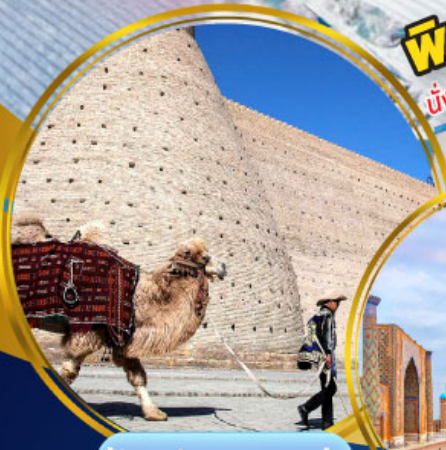
บ่อมปราทาร์บุคาร่า