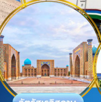
จัตุรัสเรจิสถาน