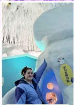
พิพิธภัณฑ์น้ำแข็ง