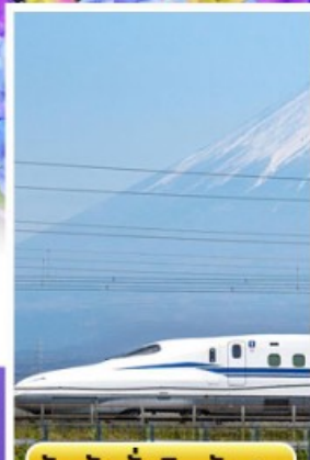
สัมผัสนั่งชินคันเซน