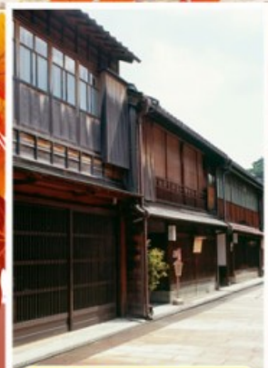
ย่านอิงาชิบายะ