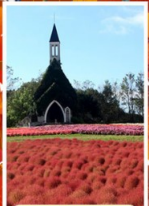
สวนบกกะโนะซาโตะ