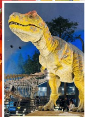
พิพิธภัณฑ์ไดโนเสาร์