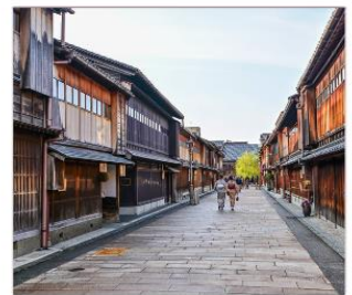
ย่านโรงน้ำชาอิงาชิบายะ

THAI สายการบินไทย บริการทุกระดับประทับใจ FULL SERVICE