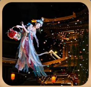
“เมืองโบราณลั่วอี้”