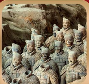
“สุสานจิ้นซีฮ่องเต้”