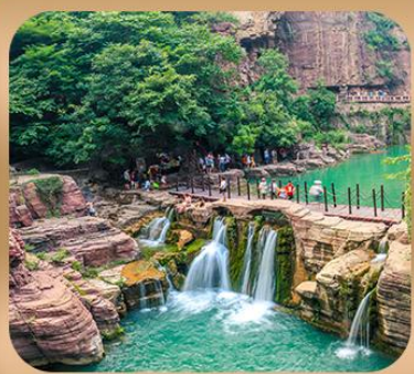
“อุทยานหยุนไต้ซาน”

ชมถ้ำหลงเหมิน มรดกโลกที่เมืองลั่วหยาง • สุสานจิ้นซีฮ่องเต้ • ศาลเจ้ากวนอู วัดเส้าหลิน + ป่าเจดีย์ + ชมโชว์กังฟู • เมืองโบราณลั่วอี้ • อุทยานหยุนไต้ซาน เจดีย์ห่านป่าใหญ่ • ถนนวัฒนธรรมต้าถัง • ถนนคนเดินอิสลาม • จัตุรัสหอระบิง