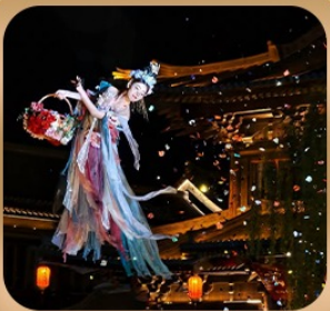
“เมืองโบราณลั่วอี้”

ชมถ้ำหลงเหมิน มรดกโลกที่เมืองลั่วหยาง • สุสานจิ้นซีฮ่องเต้ • ศาลเจ้ากวนอู วัดเส้าหลิน + ป่าเจดีย์ + ชมโชว์กังฟู • เมืองโบราณลั่วอี้ • อุทยานหยุนไท่ซาน เจดีย์ห่านป่าใหญ่ • ถนนวัฒนธรรมต้าถิง • ถนนคนเดินอิสลาม • จัตุรัสหอรบะซิง