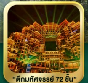
"ตึกมหัศจรรย์ 72 ชั้น"

นั่งกระเช้าชมภูเขาเทียนเหมินซาน • กำประตูลิ่ว • ทางเดินกระจก เมืองโบราณเฟิ่งหวง • เมืองโบราณฟูหลงเจิน • ชมโซ่วจิ้งจอกขาว ภูเขาเทียนจื่อซาน (รวมลิฟต์แก้ว) • หุบเขาอวตาร • ตึกมหัศจรรย์ 72 ชั้น