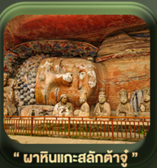
“ ผาหินแกะสลักต้าจู้ ”

วันเดินทาง มี.ค. - ต.ค. 2569 ราคาเริ่มต้น 22,999.-