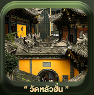
“ วัดหลัวฮั่น ”