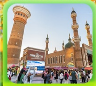
"ตลาดต้าปาจา"

รวมรถไฟความเร็วสูง 1 ขบวน (อ๋เหมิง - อูรูมูฉี)