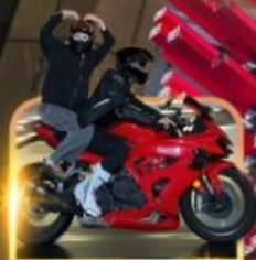
ถ่ายวีดีโอนั่งมอเตอร์ไซด์

ชิมหม้อไฟหม่าล่า นั่งรถรางชมธรรมชาติ หนาวเสียวระเบียงแก้ว