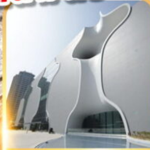
โรงละครโดง