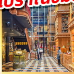
ร้านไอศกรีมมียาฮาร์