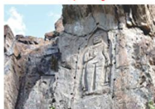
พระพุทธรูปคาร์กาห์

** พักที่ Kallisto Hotel หรือเทียบเท่า **