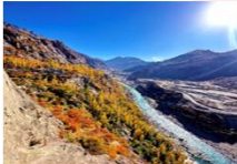
บ่อมปราการ Altit Fort

DAY4 บ่อมปราการอัลติท-ตลาดพื้นเมือง-ฮอปเปอร์ กลาเซียร์ -หุบเขาคฺยเกอร์