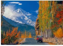
เมืองชิลาส

** พักที่ Shangrila Chilas Hotel หรือเทียบเท่า **