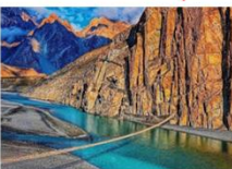
สะพานแขวนฮุสไซนี

DAY6 สะพานแขวนฮุสไซนี-กิลกิต-พระพุทธรูปคาร์กาห์