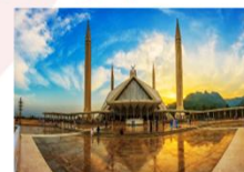
มัสยิดไฟซาล

DAY8 ตึกศิลา-พิพิธภัณฑ์ตึกศิลา-อิสลามาบัด- มัสยิดไฟซาล-Shopping-กรุงเทพ