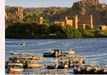
วิหารฟิเล

16.25 น. ออกเดินทางสู่กรุงไคโร สายการบิน Egypt Airlines เที่ยวบิน MS295