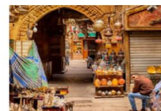
ตลาดخانเอลคาลีสี่

20.50 น. ออกเดินทางสู่อิสตันบูล เที่ยวบิน TK695