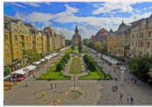
เมืองซีบีอู