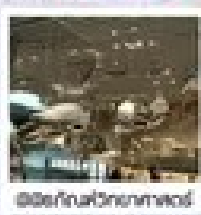
พิพิธภัณฑ์วิทยาศาสตร์