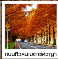
ถนนทิวสนเมตาชิคิวญา