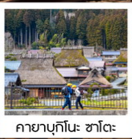
คายาบุกินะ: ซาโตะ