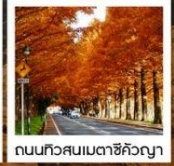
ถนนทิวสนเมตาซึกิวงญา