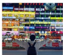
กำแพงมหาวิทยาลัยเหยียนเปียน