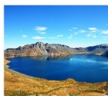
ดางไป่ซาน