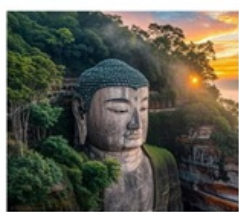
หลวงพ่อโตเล่อซาน