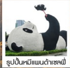
รูปปั้นหมีแพนด้าชหลี่