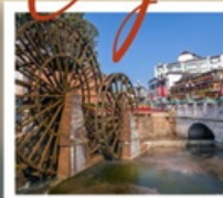
เมืองโบราณลี้เจียง