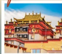
วัดลามะ:ซงจ่านหลิง