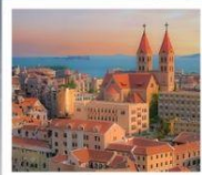
โบสถ์ ST. EMIL